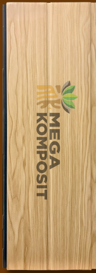
Cream Teak 782