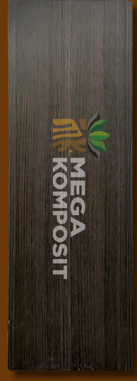
Dark Mahoni 834