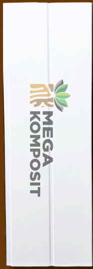
White Oak 780