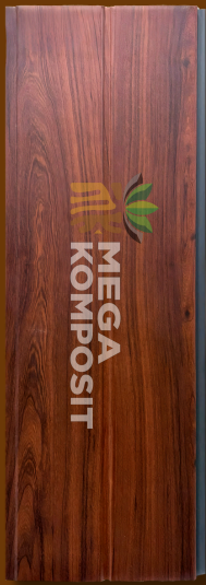
Red Mahoni 840

Size: l x t x p = 200 mm x 8 mm x 4000 mm