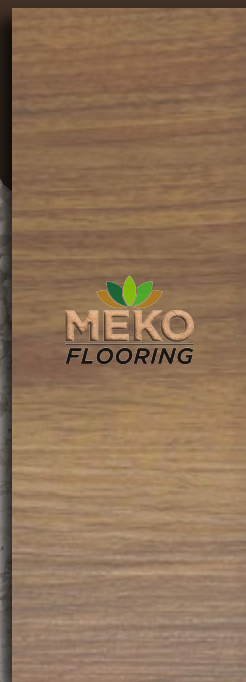
MKSC - 11