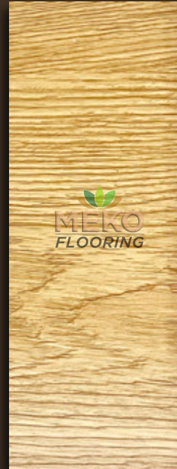
MKSC - 07