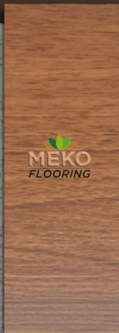
MKSC - 10