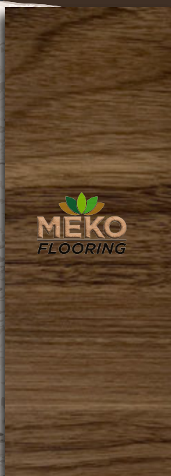
MKSC - 12