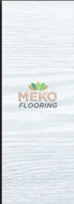
MKSC - 01