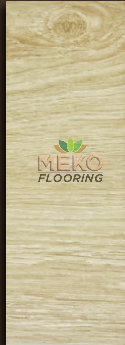
MKSC - 05