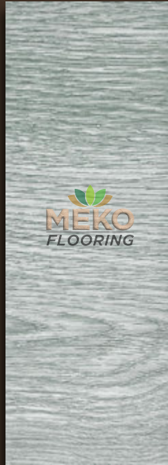
MKSC - 03